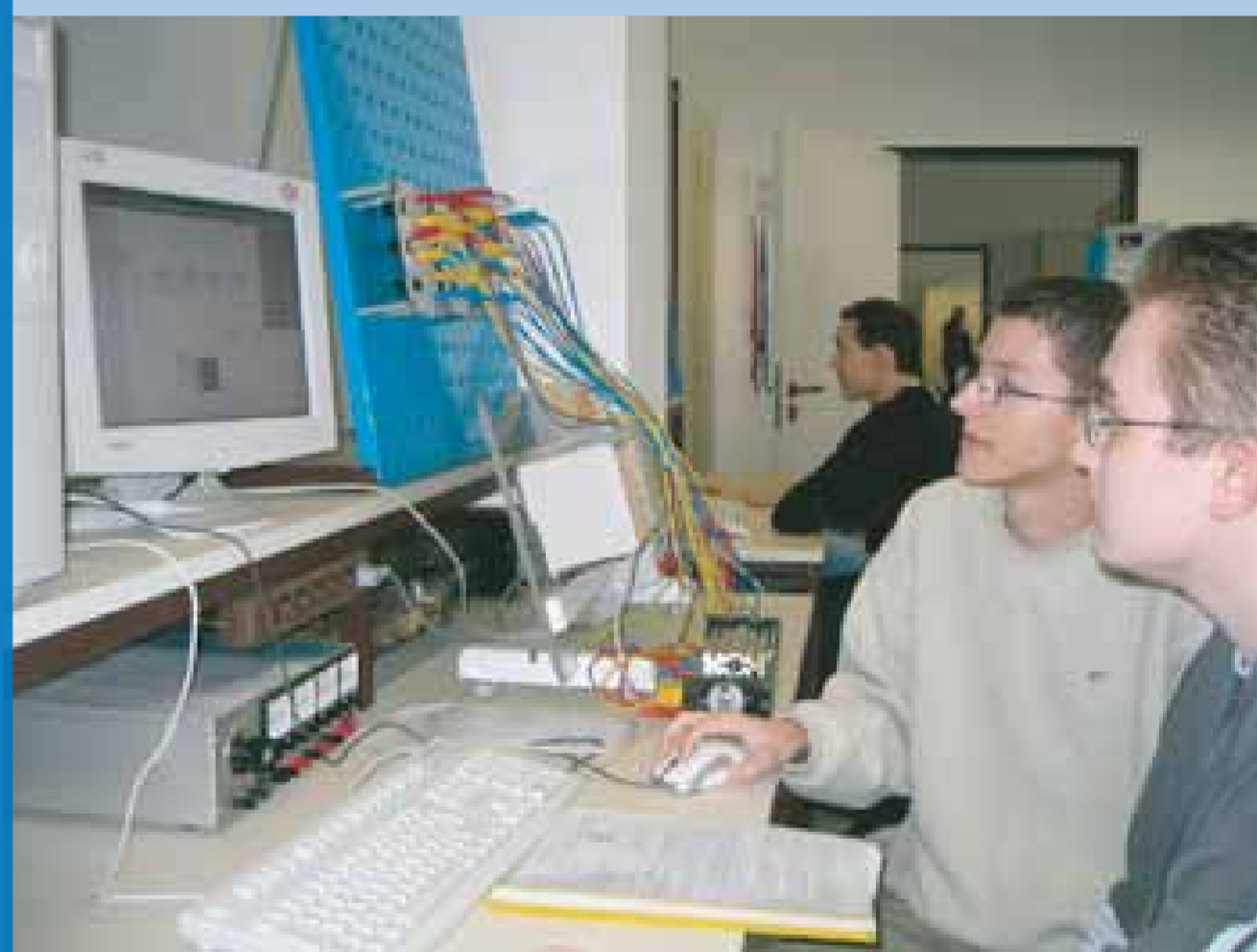
Elektro- und Automatisierungstechnik / Laborübung