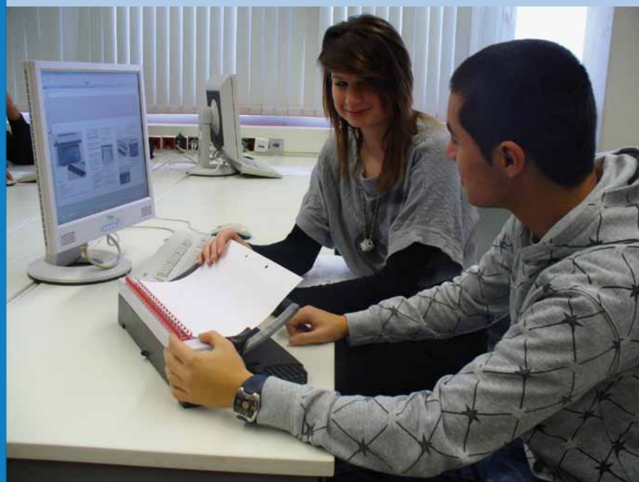
Tabellenkalkulation / Bohrmaschine

Sie visualisieren Produkte aus dem Maschinenbau, Automatisierungs- und Gebäudetechnik, Elektronik- und Softwaretechnik