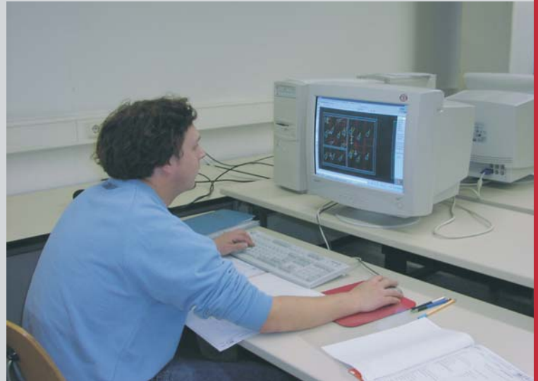
Computeraided Design / CAD Maschinenbau-, Schalt- und Bauzeichnen

erstellen Zeichnungen, Pläne und Unterlagen per Hand und vor allem am Computer (CAD) beurteilen Fertigungs- und Montageabläufe um die Funktion der Teile zu erfassen lesen und wenden technische Unterlagen an, wie Tabellen- und Fachbücher, Montagepläne, Schaltpläne, Baubeschreibungen, Materiallisten führen technische Berechnungen durch um z.B. Längen, Flächen, Winkel, Zeiten, Kräfte oder Beanspruchungen zu ermitteln.