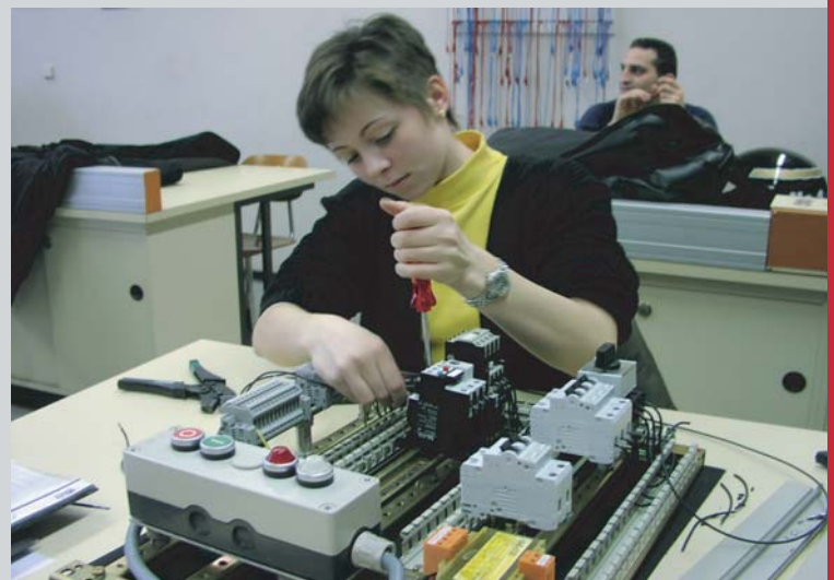
Praktische Übung im Elektrolabor